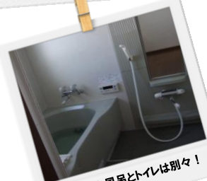
もちろん風呂とトイレは別々！