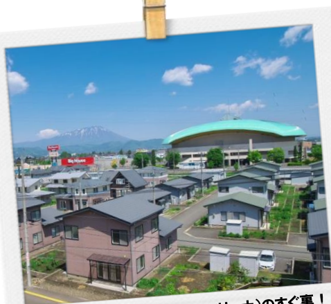
盛岡タカヤアリーナ(市アイスアリーナ)のすぐ裏！スーパーも近くにあって便利♪