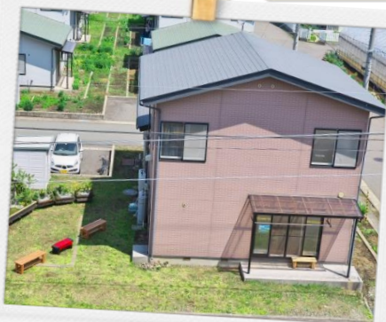
シェアハウスでの新しい学生生活を始めてみませんか？お気軽にお問い合わせ下さい！