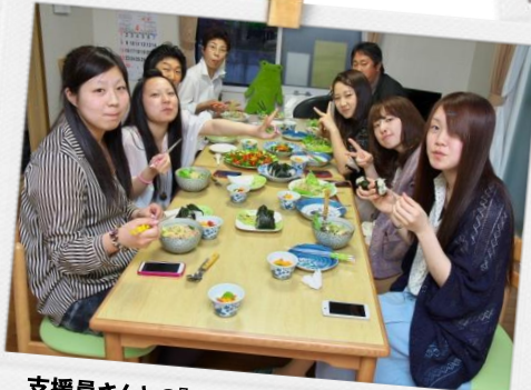
支援員さんとの『ごほんの会』。皆で楽しくお食事会です☆